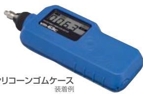
シリコンゴムケース 装着例