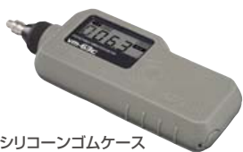
シリコンゴムケース 装着例