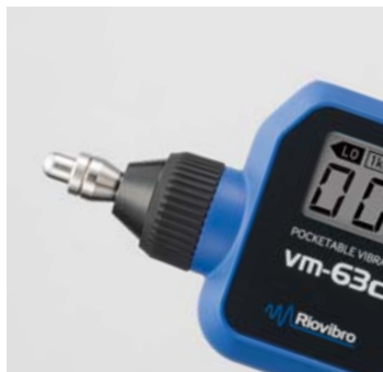
付属 (出荷時の状態)

VM-63Cの振動検出部は、測定用途によりアタッチメント(S、L、アタッチメントなし)を使い分けることができます。