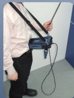
肩掛けケース使用例 ※別売です。