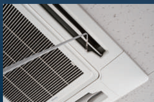
空調機器の能力試験・保守点検 (6036のみ)