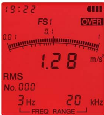
オーバーロード画面