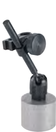
7014-10 (マグネットのON/OFFスイッチ無し)