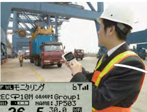
現場でモニタリング

WL モニタリング bY.nl REC 10M GROUP: Group1 NAME: JP503 26.5 30.0 WB 10.0 10.0 [°C] 32.0 30.0 WB 20.0 20.0 [%RH]