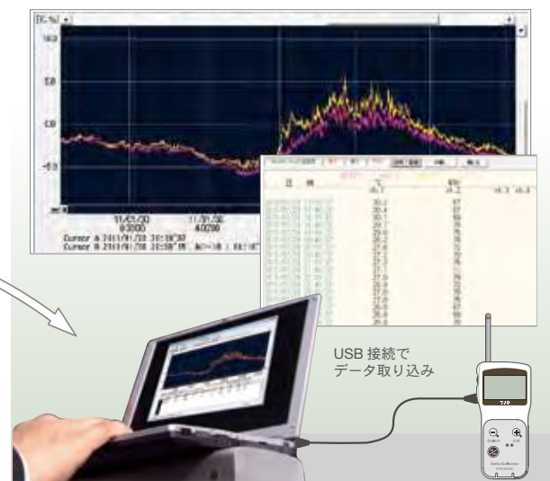
事務所でデータ確認

WL モニタリング bY.nl REC 10M GROUP: Group1 NAME: JP503 26.5 30.0 WB 10.0 10.0 [°C] 32.0 30.0 WB 20.0 20.0 [%RH]