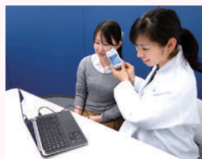
カウンセリングの様子