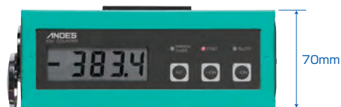
簡単操作、見やすい大型ディスプレイ