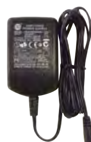
親機用 ACアダプター