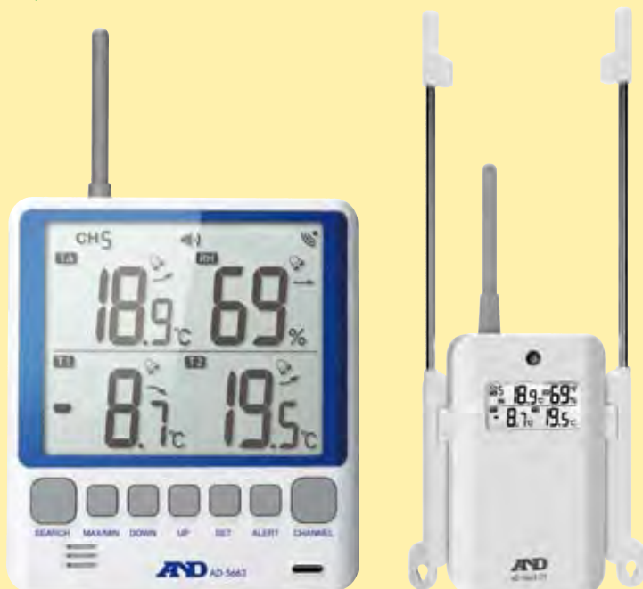
親機 (表示器・受信機)