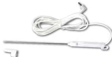
子機用 温度プローブ (1本)