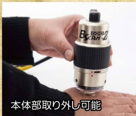
本体部取り外し可能