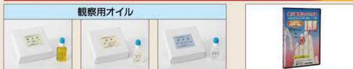
指先用 5本入りセット