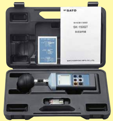
SK-150GT専用ハードケース

※WBGT指数：Wet Bulb Globe Temperature (湿球黒球温度)の略で、ISO 7243/JIS Z8504で規定されている作業者の熱ストレス (暑熱環境) の評価に使用される指数です。 湿球温度、黒球温度 (輻射熱)、乾球温度から算出される体感温度のひとつです。