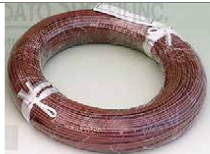
T型被覆熱電対センサー VTF-100M