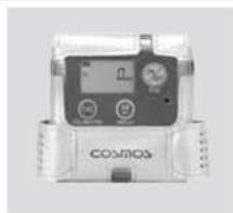
●耐熱レザークース(C-12)