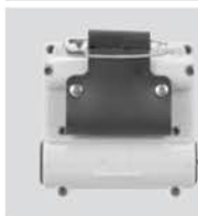
●安全ピンアダプタ(取付ねじ付)1個(C-10)