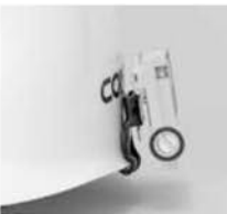
●ヘルメットクリップセット(ST-6)