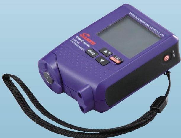
落下防止用のストラップ付

LCD表示部はバックライト機能付なので測定箇所が 暗い場所でもLCDの数値が読みやすく測定作業に 集中できます。