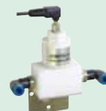
インライン測定用パッフル: BF-JK ※チューブ継手は、含まれません。