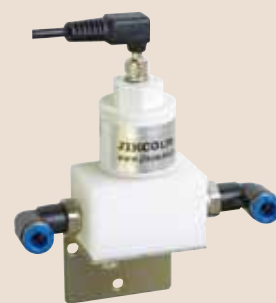
インライン測定用パッフル：BF-JK ※チューブ継手は、含まれません。