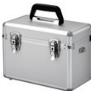
キャリングケース (ALC-3)