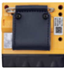
安全ピンアダプタ (C-25)