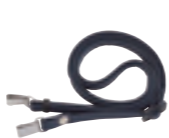
ネックストラップ (ST-15) ※使用にはレーザーケースが必要です