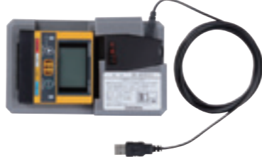
ロギングデータ収集セット (XA-4000II) 赤外線通信で、機器本体に蓄積されたデータをパソコンに取り込みできます。