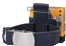
アームベルト (ST-11) ※使用にはベルトクリップが必要です