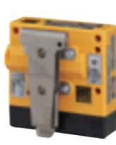
ベルトクリップ [専用ストラップ付] (ST-16)