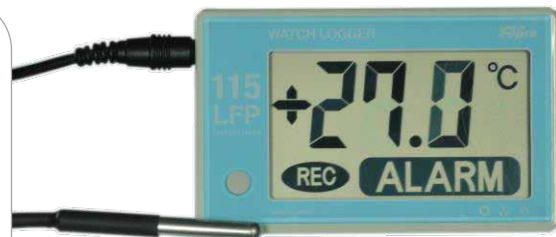
プローブ型温度ロガー KT-115LFP 取付アダプタ AT-200 標準価格 14,800円(税抜) 標準価格 1,500円(税抜)

WATCH LOGGERは、医療機関における温度管理を簡単に、かつ確実に実現する電子記録計です。