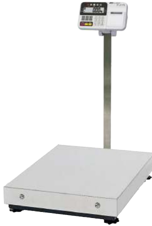
HW-CP/HV-CP 内蔵プリンタモデル