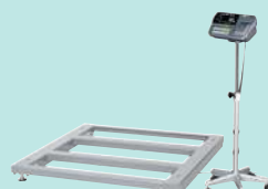
低床型 高さ 120mm SN-1200KL