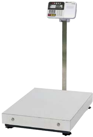
HW-C / HV-C