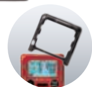
プロテクトカバー (4777 4161 10)