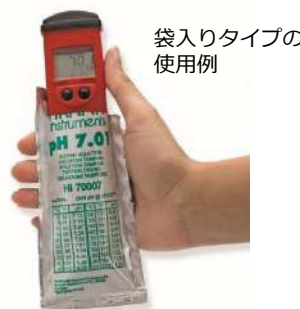
袋入りタイプの 使用例