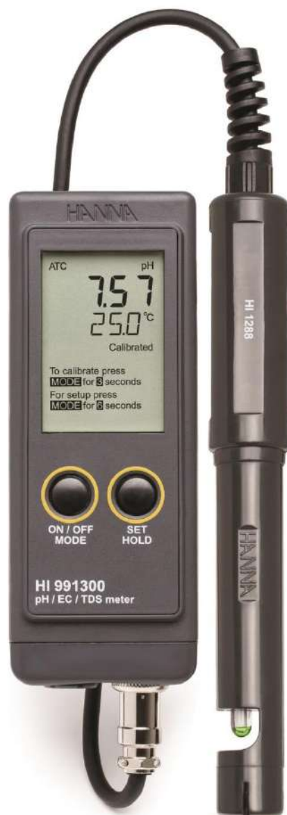
HI 991300N (pH/EC/TDS/°C)