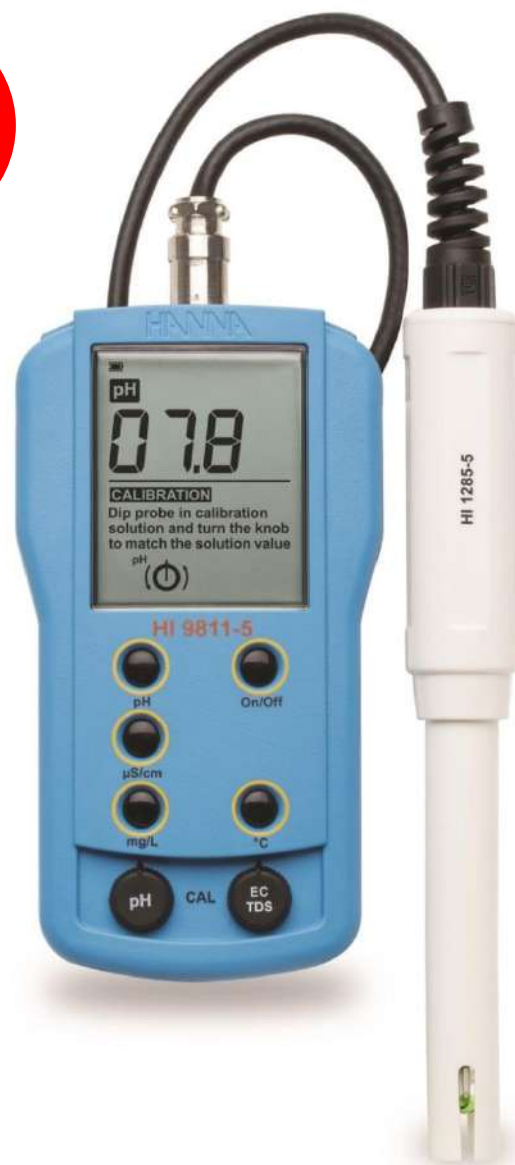
HI 9811-5N (pH/EC/TDS/°C)