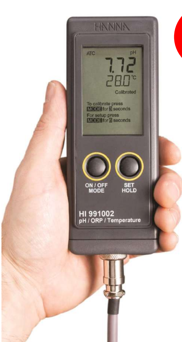
HI 991002N (pH/ORP/°C)