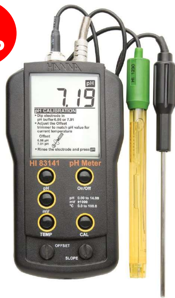
HI 83141N (pH/ORP/°C)