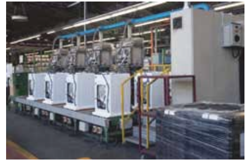
工場内の作業環境測定に