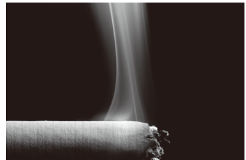
たばこ煙の測定に