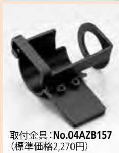
取付金具:No.04AZB157 (標準価格2,270円)