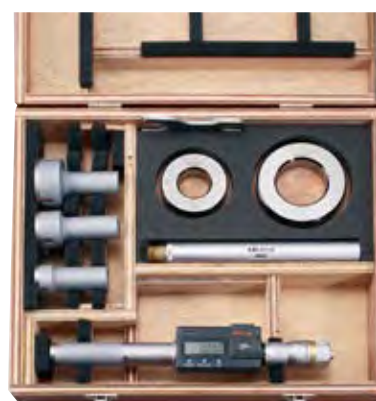
エコノミーセット(測定ヘッド交換式) ※詳細はC-5ページをご参照ください。