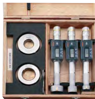
フルセット ※詳細はC-6ページをご参照ください。