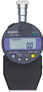
GSD-719J タイプAデュロメータ ・デジタル式 ・ピークホールド付