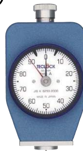
GS-719R タイプAデュロメータ ・スタンド取付兼用型 ・置針式