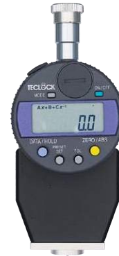
GSD-719J-R タイプAデュロメータ ・デジタル式 ・スタンド取付兼用型 ・ピークホールド付