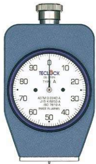
GS-719N タイプAデュロメータ ・一般ゴム用