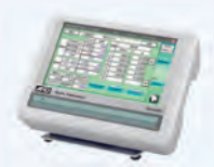
ピペット管理ツール AD-1695

※ ピペットの運用・管理方法について、使用現場でのSOP作成についてもご相談を受付ています。また、天びん・はかりを含めた定期点検・JCSS校正証明書発行も承っております。