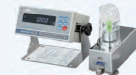
ピペット容量テスター AD-4212B-PT