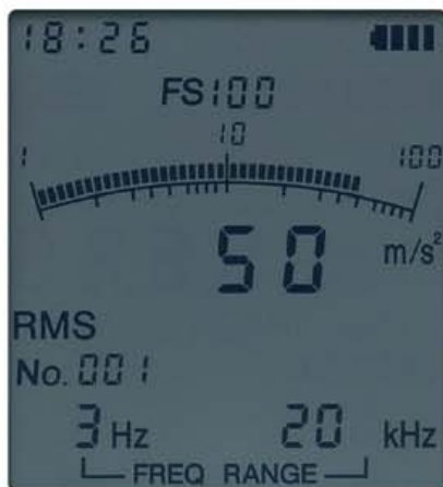
測定データの表示画面

液晶画面にはバググラフと数値が同時に表示され、変動の様子を容易に把握。設定した周波数範囲などの情報も表示し、バックライト機能により暗所でも内容を確認できます。オーバーロードの状態になると、OVERが表示され、液晶全体が赤色に変わります。