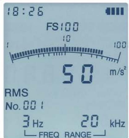
バックライトの点灯