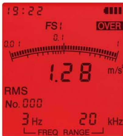
オーバーロード画面