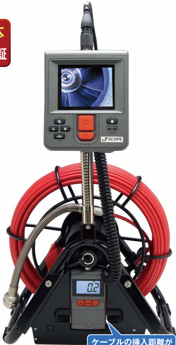
ケーブルの挿入距離が一目でわかるメーター付