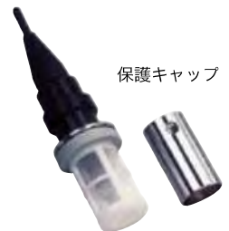
残留塩素電極 (ビーズ研磨キット装着時)