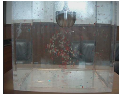
③吸い込まれたビーズが横の吐出口から吐き出される