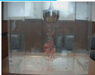
②下の吸入口からビーズが吸い込まれる