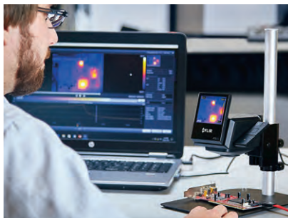
USBでコンピューターに接続し、FLIR Tools+ でデータを分析