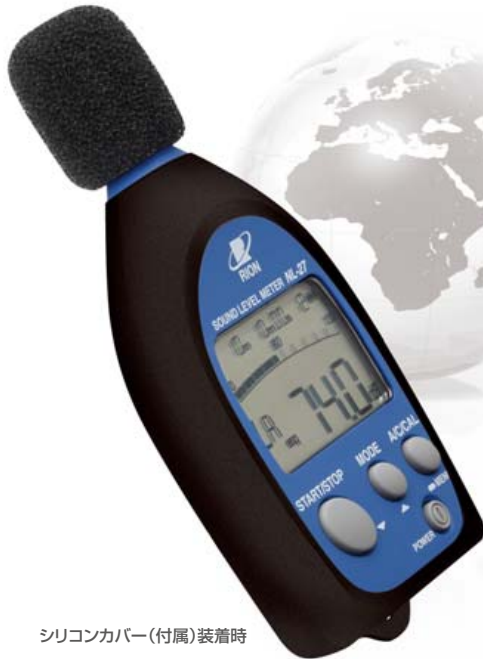
シリコンカバー(付属)装着時