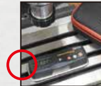
1台で2軸を同時測定