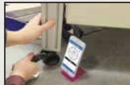
1人で測定しながら作業可能