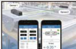
2台のデバイスと同時に同期が可能