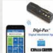
スマホ、タブレットとBluetooth接続で作業効率UP