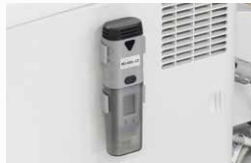
必要に応じて取り付け部品を使用します