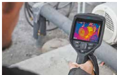
高視野角 高輝度IPS液晶