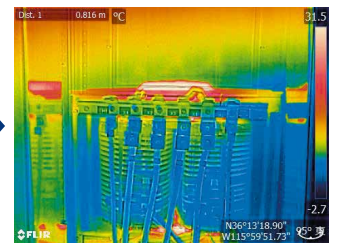
MSX ® モード