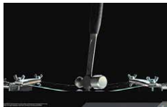
カバーガラスにDragontrail ® 採用