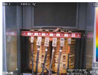
デジタルカメラモード

MSX ® 機能(スーパーファインコントラスト機能)は、リアルタイムで画像を補正することができ、構造物の詳細や発熱箇所の判別が熱画像上で容易に行えます。また、デジタルカメラモードとの同時撮影も可能で、同画角の可視画像を簡単に生成することができます。