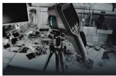
タイムラプス撮影 (E95)