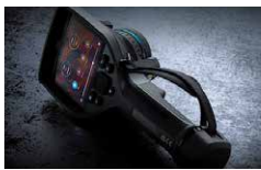
国内フルメンテナンス