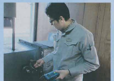
ダクト内測定、風洞実験に