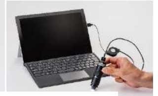
お手持ちの PC に接続しての利用が可能