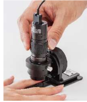
130×から 510×の拡大縮小のズーム調整機能付き

①指先血流モード ②肌・頭皮血流モード ③表皮・自然色モードの3つのモードの利用ができます。