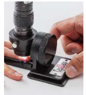
専用架台（特許出願中）位置調整がスムーズで簡単