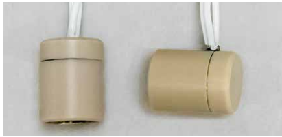
(左) ストレート (右) Lタイプ