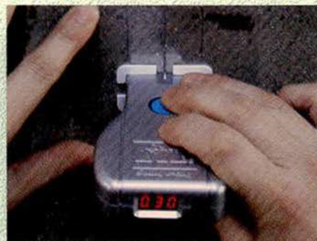
2次にMarking Sheetの白い枠に合わせてCrack EYEをセットし、Crack EYEのボタンを押します。CrackEYEに測定結果が表示されます。