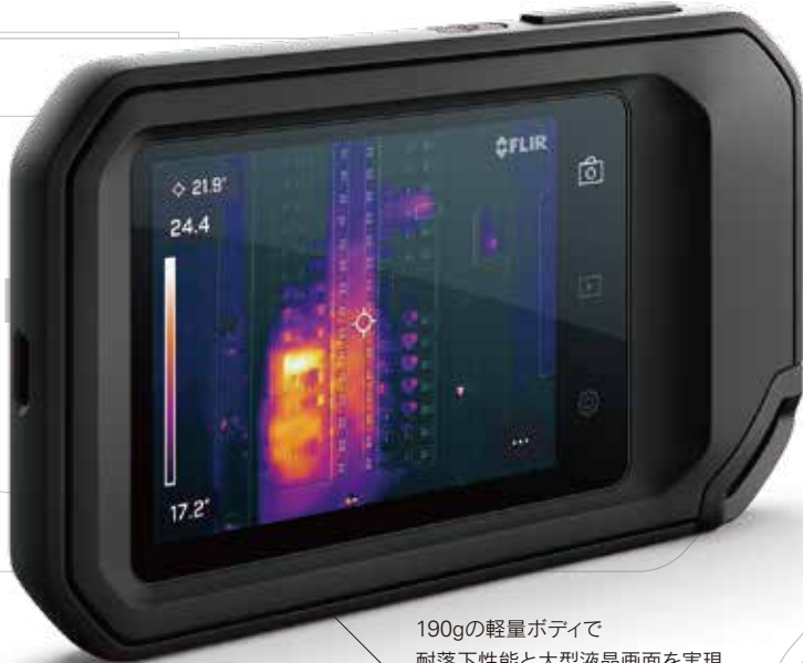
190gの軽量ボディで 耐落下性能と大型液晶画面を実現