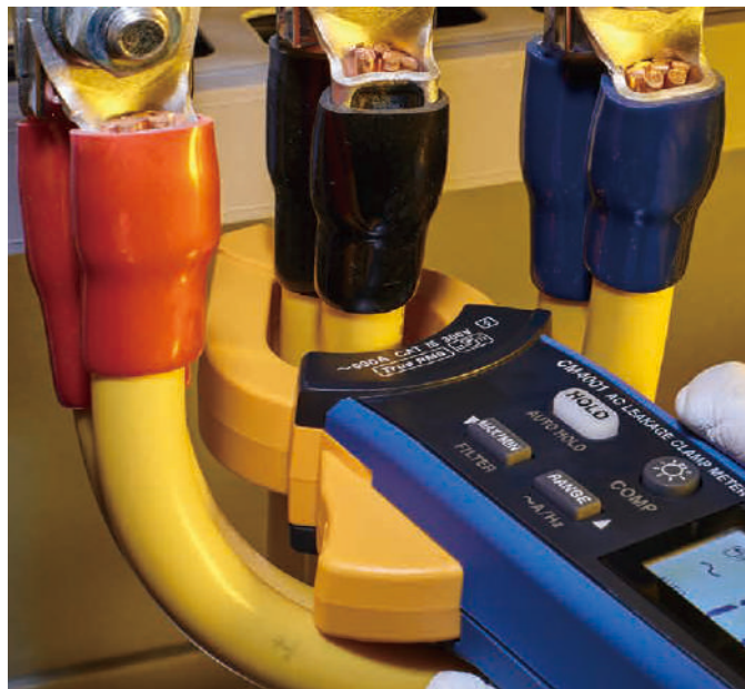
間隔の狭い太線やダブル配線もスムーズに挟める