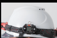
ヘルメットバンド装着時 ※ベルトクリップ装着