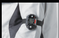
腕装着時(バンド型) ※アームバンド装着