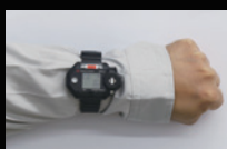
腕装着時(腕時計型) ※時計ベルト装着