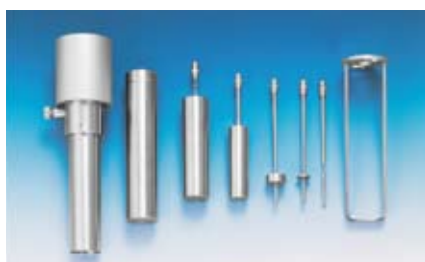
Mロータセット+BLアダプタ