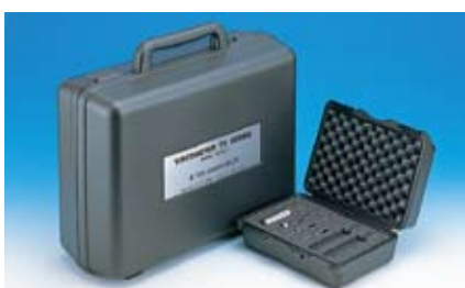
本体収納ケース・ロータ収納ケース