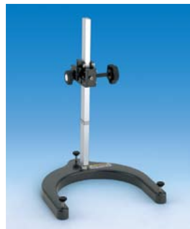
ローラースタンド