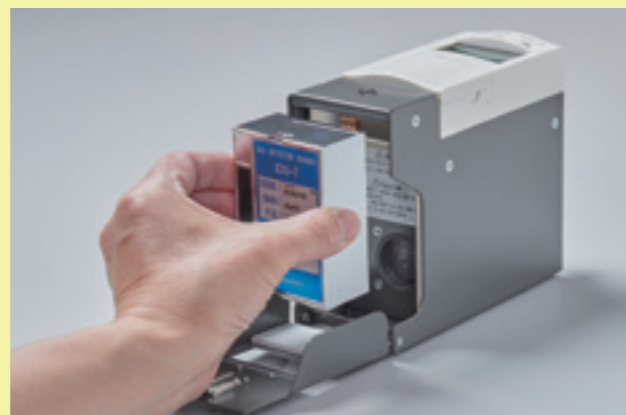
②センサユニットを取り出し、新しいセンサユニットを差し込みます。 ③センサユニットカバーを閉じれば交換終了です。