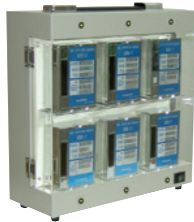
◎センサユニットは専用通電台(EC-7)で通電してください。