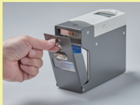
①側面のセンサユニットカバーを開けます。