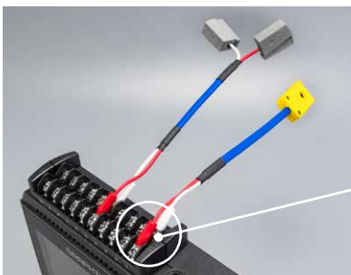
対応機種との接続例