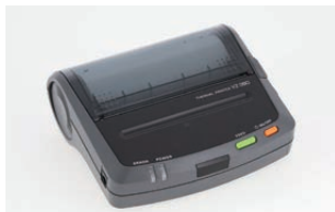
プリンタVZ-380(オプション)