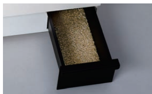
大きな試料ケース

測定後の試料が排出される試料ケースは、大容量となっておりますので、測定ごとに試料を廃棄する必要がありません。また、試料搬送部が詰まった場合は、本体横扉を開け容易に清掃ができます。