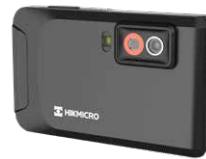
ポケットサーモグラフィカメラ Pocket2