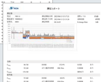
測定データグラフ表示