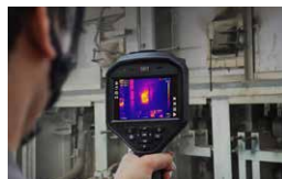
機械設備の検査に