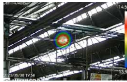
工場の設備点検に