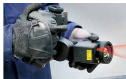
回転レンズ・スクリーン搭載