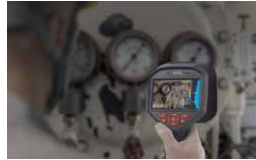
片手で持てる軽量設計