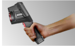
片手で持てるハンディタイプ