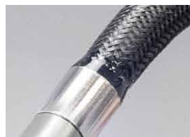
Φ6.0mm タングステンケーブル