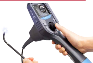
軽快なジョイスティック操作

細管の湾曲形状への挿入も手元押込みがスムーズになり、最小クラスの先端硬質長が先端の曲がり、通過性を強力にアシストします。