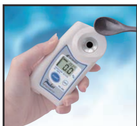
① プリズム面にサンプルを滴下します。