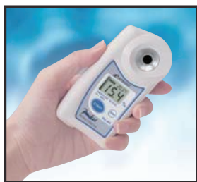
③ 約3秒後に濃度%を表示します。