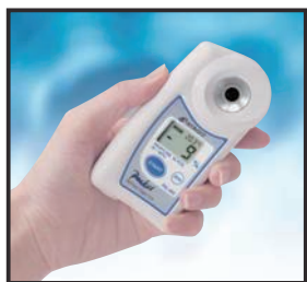
④ STARTキーを2秒以上押し続けると凍結温度を表示します。