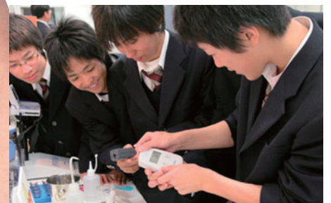
スーパーサイエンスハイスクール 京都市立堀川高等学校 環境授業にて